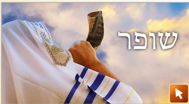
Le chofar à Roch Hachana