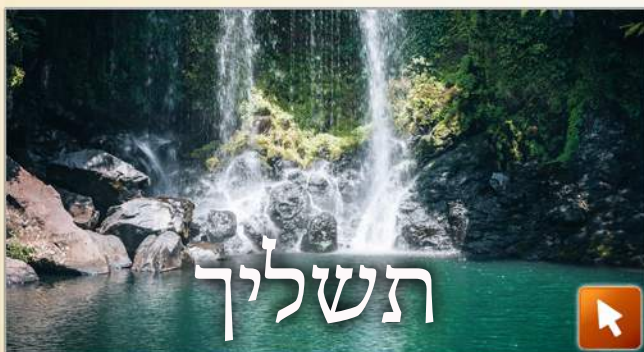
Jetez vos péchés !