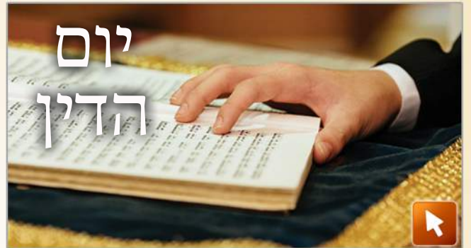
Le jour du jugement