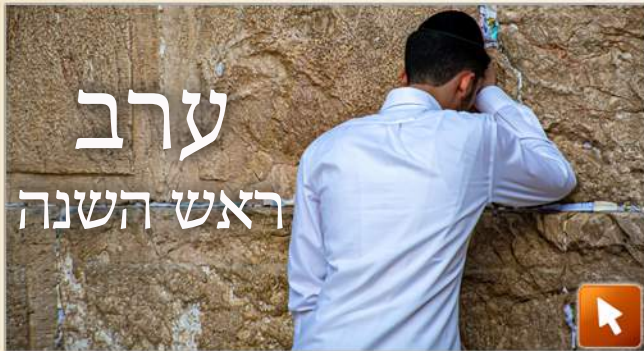
La veille de Roch Hachana