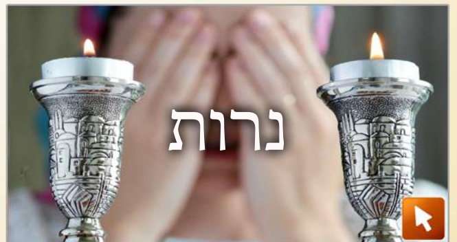
Calendrier 2024 de Roch Hachana